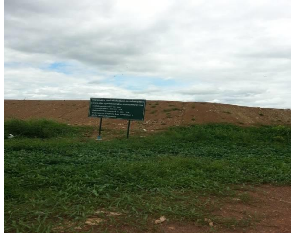
ภาพที่ 2 พื้นที่บ่อฝังกลบขยะของเทศบาลเมืองอุตรดิตถ์

ระบบบำบัดน้ำเสีย จังหวัดอุตรดิตถ์มีระบบบำบัดน้ำเสียชุมชน จำนวน 2 จุด โดยใช้ระบบบำบัดน้ำเสียตะกอนเร่งชนิดถังสำเร็จรูป จุดที่ 1 ในบริเวณสวนสาธารณะริมแม่น้ำน่านหลังลานพระบรมรูปรัชกาลที่ 5 ตำบลท่าอิฐ อำเภอเมือง จังหวัดอุตรดิตถ์ และจุดที่ 2 ในบริเวณสวนสาธารณะเกษมราษฎร์ ตำบลท่าอิฐ อำเภอเมือง จังหวัดอุตรดิตถ์ เป็นระบบถังบำบัดแบบเกรอะ-กรองเติมอากาศ (Septic and Aeration Filter) เป็นถังบำบัดน้ำเสียสำเร็จรูปขนาด 80 ลบ.ม. ต่อวัน ถังบำบัดน้ำเสียออกแบบให้ฝังอยู่ใต้ดินจุดละ 2 ถัง สามารถรองรับน้ำเสียเต็มศักยภาพของระบบได้ 160 ลบ.ม./วัน/จุด รวมทั้งสิ้นประมาณ 320 ลบ.ม.ต่อวัน ซึ่งปัจจุบันไม่สามารถใช้งานระบบบำบัดน้ำเสียทั้ง 2 จุด ได้เนื่องจากประสบปัญหาอุทกภัยในปี 2553 และเทศบาลเมืองอุตรดิตถ์อยู่ระหว่างจัดทำงบประมาณในการซ่อมบำรุงระบบบำบัดน้ำเสีย โดยประมาณการค่าซ่อมแซมระบบรวบรวมเป็นค่าดำเนินการทั้งสิ้นประมาณ 1,500,000 บาท